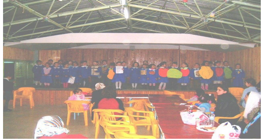
TUTUM YATIRIM VE TÜRK MALLARI HAFTASI

Bu vatanın gençleri Tıpkı ataları gibi Mutlu gözlerle bakıp Can değil vatan diyor